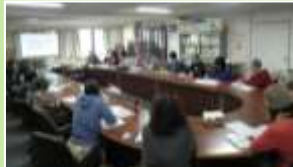
空き家問題を考える学習会(右) トトロの森散策ツアー(左)

講師派遣について 身近な地域に講師をお呼びすることも可能です。2017年度は、「お片づけ」「おせち」「ワイン」「防災備蓄」「操体法」「スパイス」などをテーマに講師派遣の依頼をいただきました。